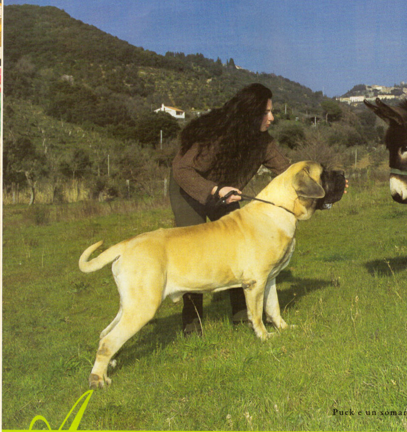
Puck e un somaro