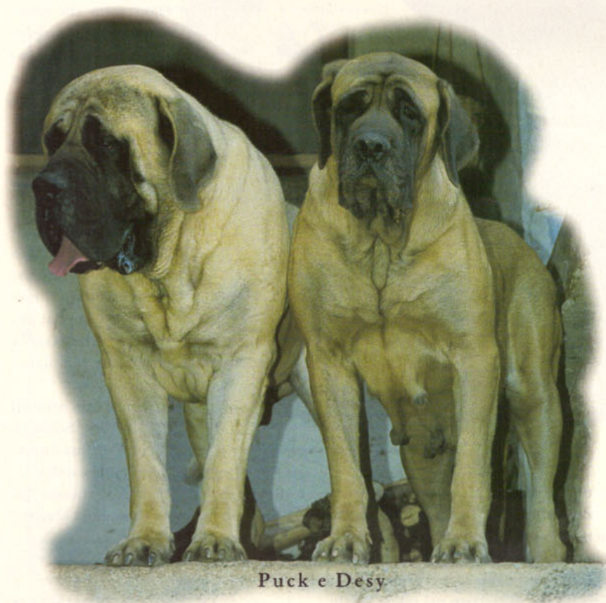
Puck e Desy